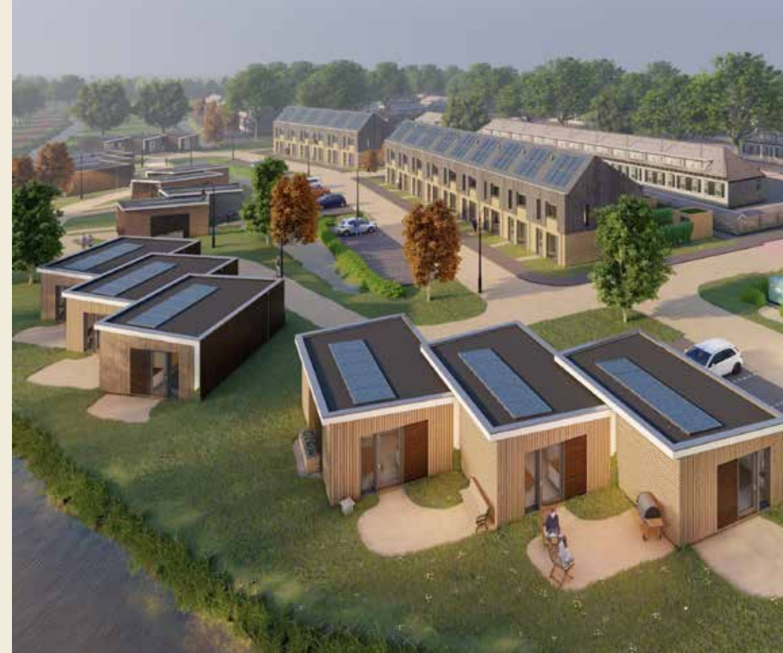
Nerf (rug-aan-rug) en Noest (op achtergrond) met een gelijke gevel