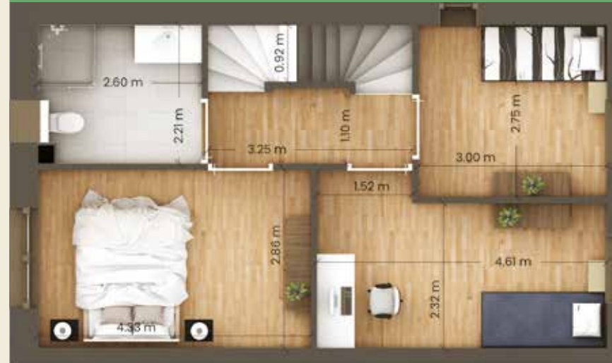
1e verdieping optie B