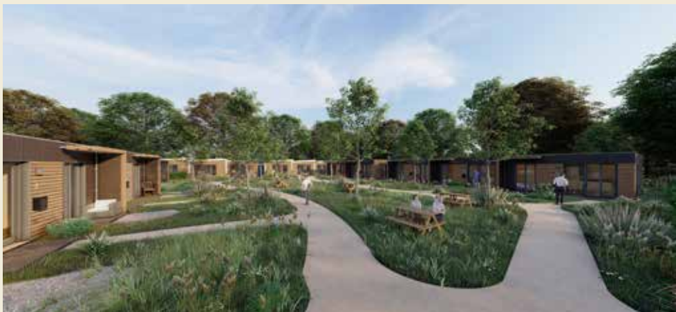
Een sociale en groene buurt

Compacte en eengezinswoningen combineren ↷