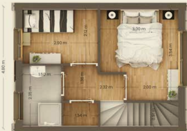
Eerste verdieping 4.8