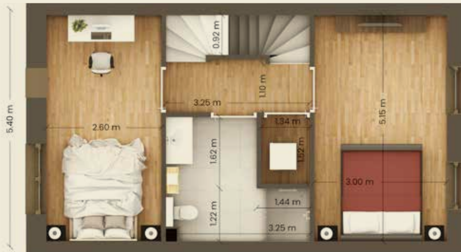
1e verdieping optie A